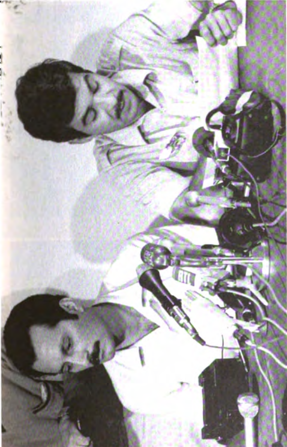
بسام أبو شريف و غسان كنفاني